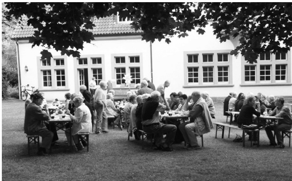
Sommerfete des Vereins im Garten des Wiese-Gemeindehauses.