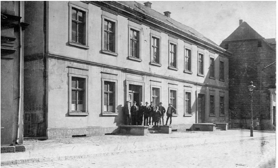
Abb. 2.: Das Postgebäude an der Jakobstraße, vor 1890.

Meine liebe Frau war auch sehr fleißig [beim Hausbau]. Sie machte die Lehmsteine, womit das ganze Haus gemauert wurde. Ich mußte jeden Sonntag die Maurerleute und Schreiner bezahlen, sonst kamen die nicht wieder. Das waren alles arme Leute. 40 Reichstaler von der Sparkasse, das ist alles, was wir geliehen haben, dazu sage ich, daß ich ohne die Poststelle nicht leben konnte. 1828 ging ich als Postillion an