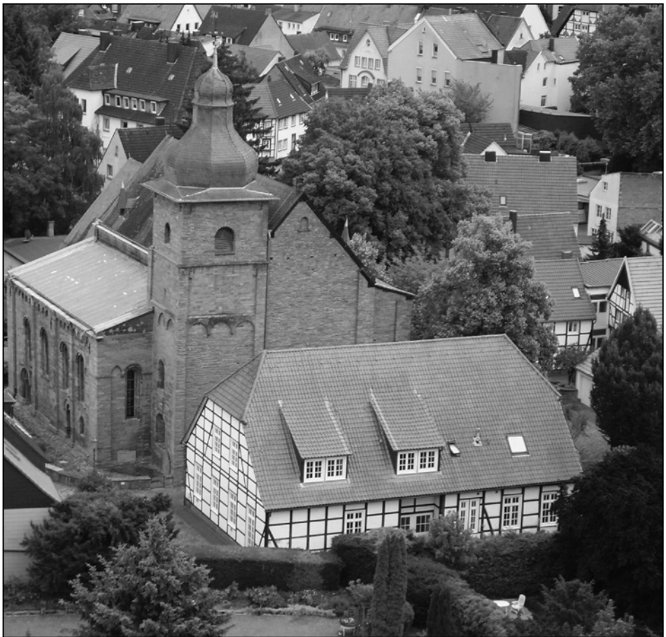
Abb. 2: Hohne-Gemeindehaus mit Hohnekirche, 2011.