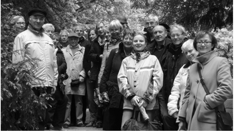
Am 25. Mai unternahm der Verein eine Fahrt nach Düsseldorf, unter anderem zum Medienhafen und zum Landtag. Das Foto zeigt die Teilnehmer im Düsseldorfer Hofgarten, dem ältesten deutschen Volkspark, den Maximilian Friedrich Weyhe in den Jahren 1804 bis 1835 gestaltete.