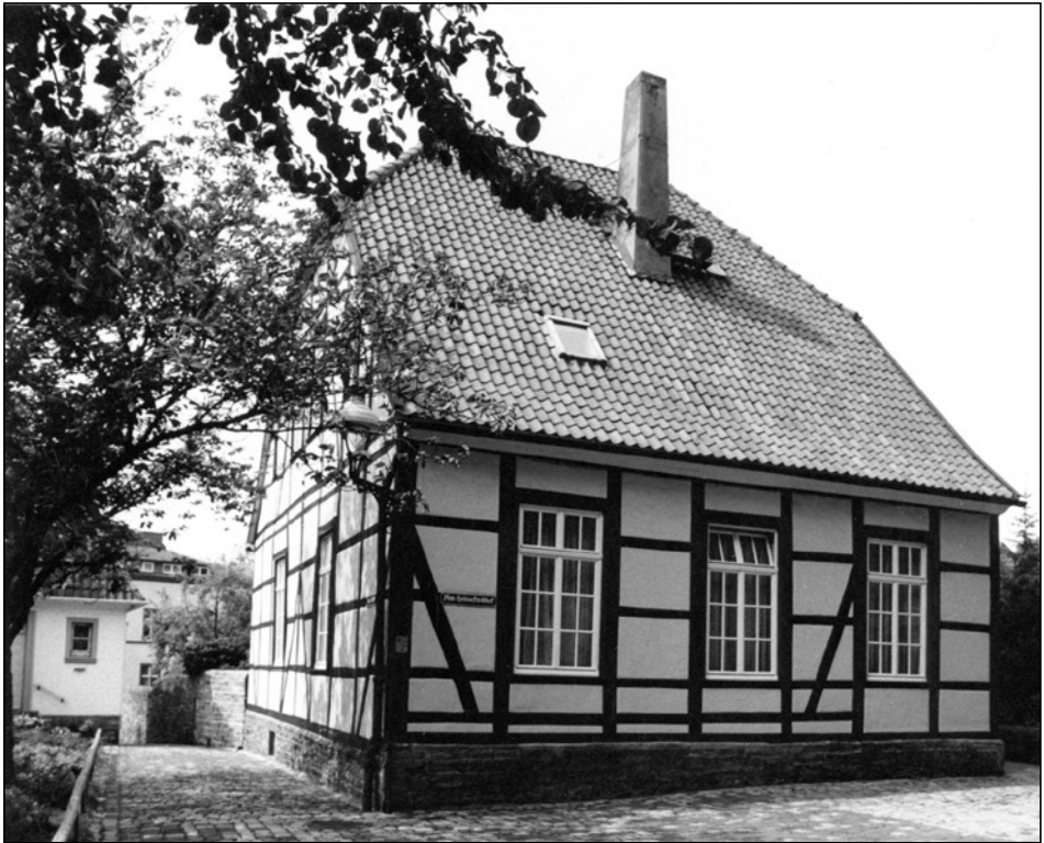
Abb. 1: Hohne-Gemeindehaus am Hohnekirchhof, 1980.

Die zunehmende Industrialisierung, besonders die seit 1850 fahrende Eisenbahn, sorgte für eine schnelle Bevölkerungszunahme, so dass die für 280 Schüler geplanten Klassenräume der „Hohne-Schule“ nicht mehr reichten. 1860 zogen die Kinder in die neue Schule an der Schültingerstraße.