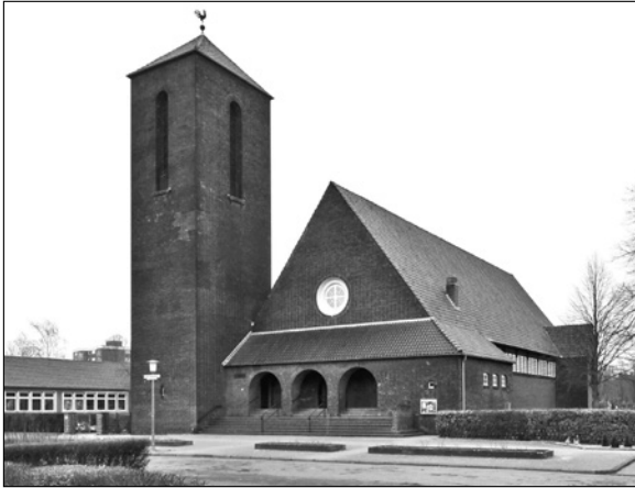
Die Johanneskirche in Hamm-Norden.