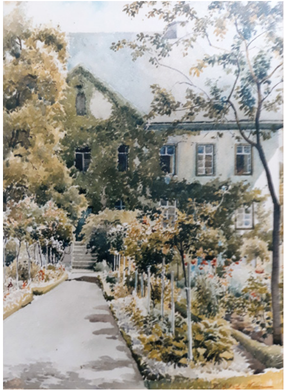
Aquarell: Karl H'loch, Privatbesitz

Nach ihrem Tod teilten sich die Mieter die Gartennutzung und -pflege, und das Aussehen des Gartens veränderte sich stark. Den Besitzern des Hauses war der Garten um das Haus über Generationen hinweg ein besonderes Anliegen und eine große Freude gewesen. Auch wenn die letzte Eigentümerin der Familie Fromme ihren Lebensmittelpunkt mit ihrer Familie in Süddeutschland hatte und sie sich nur zeitweise in Soest im „Weißen Haus“ aufhielt, wurden Haus und Garten immer hoch geschätzt. Es war ein Glücksfall, dass sich eine andere Soester Familie dazu bereit fand, dieses Anwesen als Familiensitz zu übernehmen, aufwändig, fachgerecht und behutsam zu restaurieren, den Bedürfnissen der neuen Bewohner vorsichtig anzupassen und auch den Garten wertschätzend