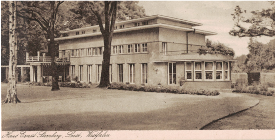
Villa Sternberg, Roßkampffgasse 6

von großzügiger Weite und Tiefe wird durch die Staffelung und Farbwirkung der Bepflanzung betont: Eiben und andere dunkellaubige Bäume im Hintergrund – davor in Höhe, Wuchsform, Laubfarbe und -struktur unterschiedliche Solitärbäume auf der ruhigen, hellen Rasenfläche. Die Wipfel der Bäume im Bergenthalpark schließen sich als Fortsetzung an. Zu dem reizvollen Spiel von Licht und Schatten auf der weiten Rasenfläche kommt noch die Spiegelung des Himmels im Schwimmbekken am Rand des Rundweges hinzu. Jahrzehntelang tummelten sich auch Zwerghühner in lockerer Gruppierung auf dieser Fläche und verstärkten durch ihre Kleinheit noch diesen Eindruck von grenzenlos erscheinender Weite.